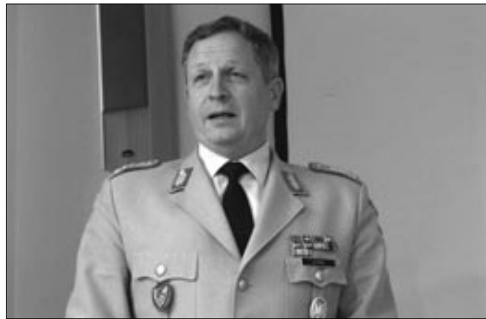
Generalleutnant Karl-Heinz Lather (Heidelberg) sprach von einer neuen strategischen Bedrohung durch die Kampfform des Terrors

lisierung in weit entfernten Einsatzgebieten fähig sei. Sicherheit – so der Generalleutnant weiter – dürfe jedoch keinesfalls nur militärisch definiert werden. Erforderlich sei ein „umfassender Ansatz, der neben den militärischen auch politische, wirtschaftliche, gesellschaftliche und kulturelle Instrumente, um den tieferliegenden Ursachen der Krisen und Konflikte Rechnung zu tragen“.