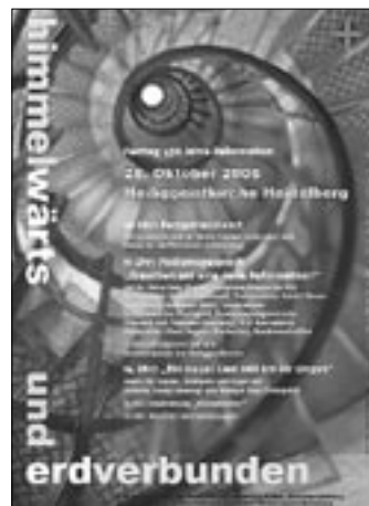
Plakat zum Festtag

Diese und andere Fragen wurden in einem mehrstufigen Konsultationsprozess unter dem Motto „himmelwärts und erdverbunden – Wegweisungen zur Zukunft des Protestantismus“ behandelt. An dem Prozess nahmen zahlreiche Bildungsträger innerhalb der badischen Landeskirche teil, eingeladen waren aber auch Kooperationspartner aus Kultur und Gesellschaft.