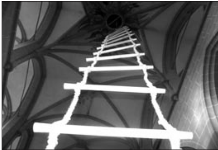
Aufwärts geht es mit dem Protestantismus – so war die Installation „Himmelsleiter“ in der Heiliggeistkirche Heidelberg zu deuten.

klüger zu werden in unserem Glauben.“ Jo Krummacher (Stuttgart), CDU-Bundestagsabgeordneter, hob auf den Grundimpuls des Protestantismus, für Bildung auf allen Ebenen einzutreten, ab: „Glauben ohne Reflexion kann gefährlich werden“. Die Klammer zwischen Glaube und Bildung müsse daher immer neu hergestellt werden. Krummacher unterstrich weiter, dass der Protestantismus deutlich mache, dass Wert und Würde eines Menschen nicht in Geld- und Gewinnmaximierung gemessen werden kann. Das bedeute im Besonderen, sich immer wieder vom Diktat eines einseitigen Ökonomismus zu befreien.