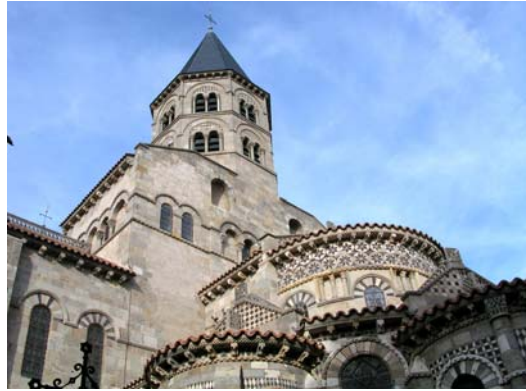
Clermont Ferrand – romanische Kirche

Weiterfahrt nach Clermont Ferrand , dort Übernachtung im zentral gelegenen Hotel Kyriad Prestige.