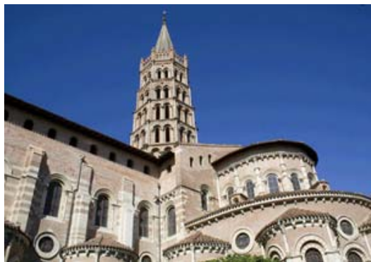
Basilika Saint Sernin in Toulouse

Besichtigung von Toulouse , mit seiner romanischen Basilika St. Sernin, der Jakobiner-Kirche und dem Romanischen Museum. Falls Zeit bleibt, werden wir auch die gotische Kathedrale besuchen. Der Graf von Toulouse war einer der Anführer der Katharer, im Verlauf des Kreuzzuges wurde Toulouse erobert und geplündert.