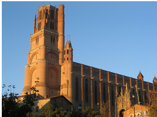
Kathedrale von Albi

Weiterfahrt nach Toulouse . Dort Übernachtung im Hotel Crowne Plaza.