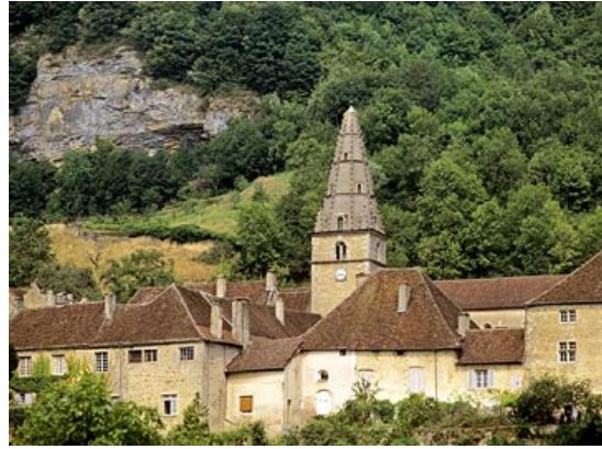
Baumes les Messieurs