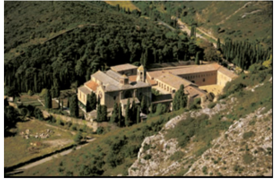
Abtei von Fontfroide

Weiterfahrt zu der romanischen Zisterzienser-Abtei Fontfroide aus dem 12. Jahrhundert, einem Zentrum des Kreuzzugs gegen die Katharer.